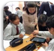
▲教育ICTで子供たちの学びを豊かに！