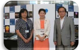
▲物質材料研究機構(NIMS)で最新の物質研究を学びます！