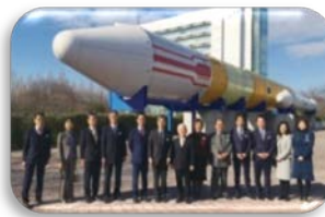
▲自民党の宇宙開発関係部会で、JAXAを見学！