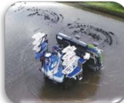
▲無人の自動運転田植え機