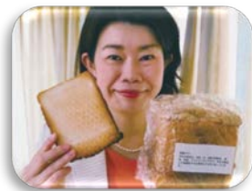
▲農研機構が開発した、アレルギーのお子様でも食べられる「グルテンフリー米粉パン」