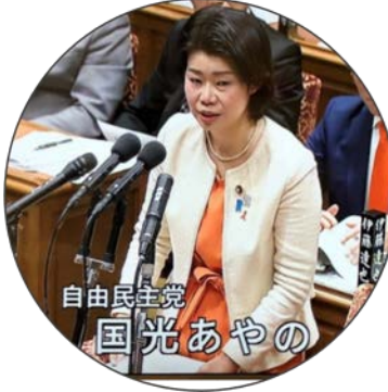
予算委員会で質問! 若手議員で異例の登板!