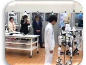
▲筑波大のイノベーションを支えます