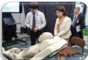
▲産総研で介護用ベッドの開発現場などを見学！！

議員になる前は、医学研究に没頭していた国光あやの。地元つくばの国会議員として、ヘルスケア、宇宙、教育、農業、交通など、様々な分野の基礎研究から応用研究に至るまで、制度や予算などイノベーションの現場を支え、早期の実用化へ！