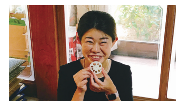
▲美味しいいれこんを頂きます!