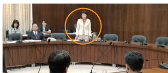
▲国会で農林水産大臣(前)、地元茨城の上野政務官(前)に、地域政策としての農業の支援、地元の農産物の輸出促進などを質問!

「地域政策」としての農業。農政は、農業の成長産業化のための「産業政策」、農村地域の活力維持向上のための「地域政策」を両輪として進める必要があります。持続可能な地域社会に向け、多面的機能、営農継続や所得向上支援、鳥獣被害対策など、地元の思いに寄り添い、予算確保や法整備を進めます!