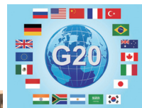
▲つくばで「G20大臣会合」開催決定!