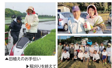
▲田植えのお手伝い ▶稲刈りを終えて

美しく豊かな水田が広がるつくばみらい市。皆様にお世話になり、田植え、稲刈りをお手伝いさせて頂きました! 自ら植えた苗が、どんどん緑が濃く大きくなり、黄金の稲穂へと実っていく風景に、改めて感動しました。農業の喜び、食の安全保障。原点を心に刻み、農業政策にしっかり活かしてまいります!