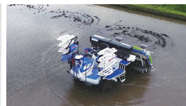
▲無人の自動運転田植え機