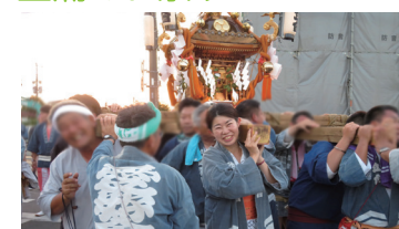
▲御神輿を一緒に担がせて頂きました!