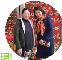
◀石岡で妊婦さんにご不安の声に寄り添います!

茨城県は「医師数(人口あたり)ワースト2」で医師不足対策は喫緊の課題です。特に石岡市をはじめ、産科医が不足し、出産や子育てのご不安の声が出ています。国会で「医師の偏在にはオールジャパンで取り組むべき」と主張。その後、実際に医師不足対策の法案が国会に提出、可決されました!