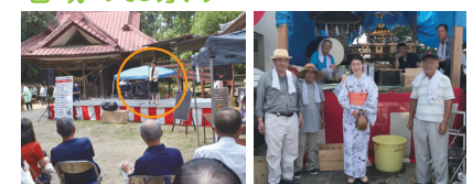
▲神社のお祭りで、地域の皆様にご挨拶! 五穀豊穡と安寧を祈り、玉里のために尽くす決意を申し上げます。