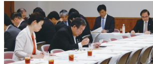
▲イノベーションの深化に向け、地元つくばで教えて頂いた知見をもとに、党の科学技術部に積極的に参加!