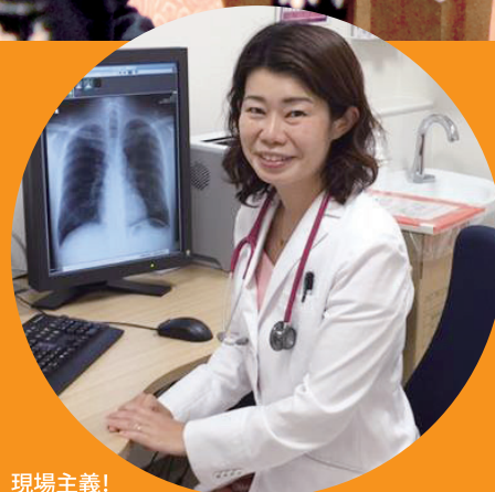
現場主義! 医師として診療も!