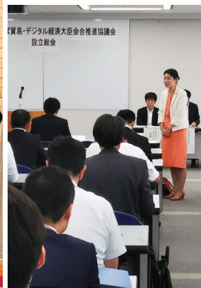
▲茨城県庁でのG20準備会合でご挨拶。各国の大臣を安心安全にお迎えし、つくば、茨城を世界にPRするためにも、地元の与党衆議院議員として、しっかり対応します!