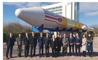
▲自民党の宇宙開発関係部会で、JAXAを視察!