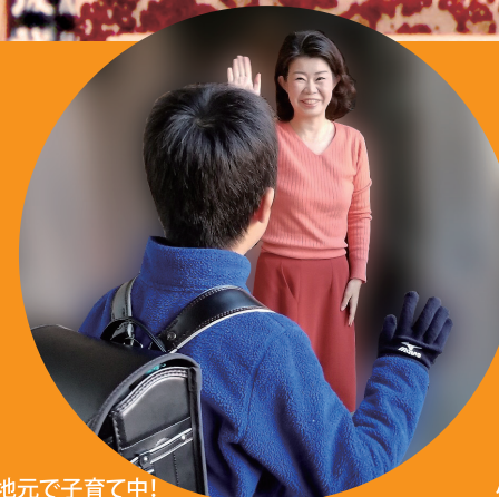
地元で子育て中! 小学生の母親です。