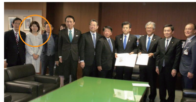
▲地元自治体首長、関係議員の皆様と石井国交大臣へ要望書を提出!

30年度に新区間(牛久~つくば市高崎)の事業化が決定し、全区間が事業化! 地域の混雑緩和や安全確保、圏央道へのアクセス強化など大きく期待されます!