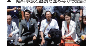
▲小泉議員とご挨拶!