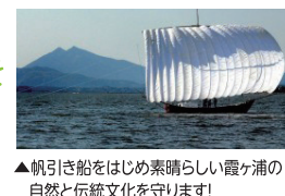
▲帆引き船をはじめ素晴らしい霞ヶ浦の自然と伝統文化を守ります!