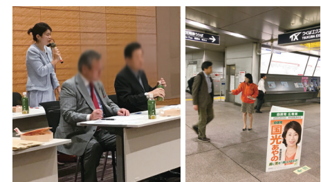
▲国会で「TX利用・建設促進議員連盟」のメンバーとして、全力で対応!

道路など必要なインフラ整備を! 企業立地、宅地開発などが進み、県内第2の都市として、人口増が続くつくば。その一方で、足元の道路ははじめインフラ整備は、残念ながらまだまだ遅れがあり、市民生活や地域経済などに影響が大きく出ています。必要な整備は、市・県・そして国の責務。国の直轄事業はもちろん、つくば市、県の整備事業予算など、国政の場でしっかりと対応します!