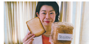
▲農研機構が開発したアレルギーのお子様でも食べられる「グルテンフリー米粉パン」を試食!

日本最大のサイエンスシティ・つくば。そのイノベーションを支えることは、地元の与党国会議員の使命です。自らも、ヘルスサイエンスなど研究に携わっていた国光。国立研究所、製薬企業など民間研究所…多くの研究所を往訪し、最新の技術を直に学び、国会でイノベーションの推進を働きかけます!