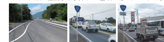
▲都市計画道路「北進道路」(東光台~国立公文書館まで6km) ▲国道125号 ▲国道354号

道路など必要なインフラ整備を! 企業立地、宅地開発などが進み、県内第2の都市として、人口増が続くつくば。その一方で、足元の道路ははじめインフラ整備は、残念ながらまだまだ遅れがあり、市民生活や地域経済などに影響が大きく出ています。必要な整備は、市・県・そして国の責務。国の直轄事業はもちろん、つくば市、県の整備事業予算など、国政の場でしっかりと対応します!