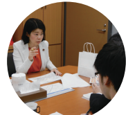
▲連日国とディスカッション!

常磐道の「つくばみらいスマートIC(仮称)」(谷部部~谷和原IC間)設置に向けて、国による調査が進行中。昨年事業化が決定した「つくばスマートIC(仮称)」に続き、つくばみらいでも、早期に事業化を進めるべく、市や地元関係の皆様と連携し、鋭意取り組んでいます!