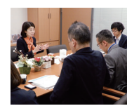
▲地域の思いを伝え、国に説明を聞きます!

地元の大きな期待「霞ヶ浦二橋」。地元でも関係市町村の皆様が期成同盟会を結成し積極的に活動を重ねています。市と県との検討状況を見守りつつ、災害時などの基盤的インフラといった地域の想いを伝え、国益の観点からも、実現の道筋をつけるべく、検討を重ねています!