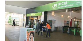
▲完成した歩道橋でご挨拶!