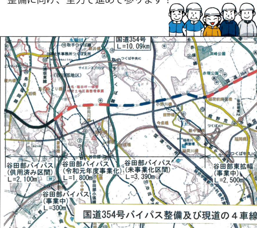
国道354号バイパス整備及び現道の4車線化