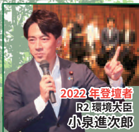
2022年登壇者 R2環境大臣 小泉進次郎