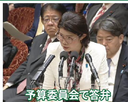
予算委員会で答弁

日本を取り巻く厳しい安全保障環境、経済安全保障・エネルギー外交、自由で開かれたインド太平洋(FOIP)の発展、日米同盟の深化、地球規模課題への貢献(中東・ウクライナ等の平和構築、気候変動、感染症対策など)・・・外交課題は山積しています。 外交の力で、日本の国益、国民の安心安全を守り抜く。国際社会の平和と安定に貢献する。国益の観点から、主張すべきは主張する。 力強い外交を、高市総理、茂木外務大臣のもと、推し進めてまいります。 もちろん外交以外の課題も、オールラウンダーとして引き続き全力! ご要望等ありましたら、いつでもご連絡ください!