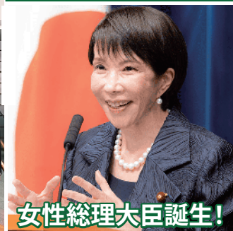
女性総理大臣誕生!