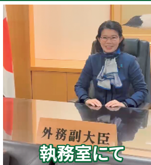
外務副大臣 執務室にて