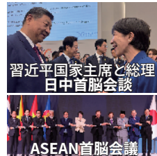
習近平国家主席と総理 日中首脳会談

日本を取り巻く厳しい安全保障環境、経済安全保障・エネルギー外交、自由で開かれたインド太平洋(FOIP)の発展、日米同盟の深化、地球規模課題への貢献(中東・ウクライナ等の平和構築、気候変動、感染症対策など)・・・外交課題は山積しています。 外交の力で、日本の国益、国民の安心安全を守り抜く。国際社会の平和と安定に貢献する。国益の観点から、主張すべきは主張する。 力強い外交を、高市総理、茂木外務大臣のもと、推し進めてまいります。 もちろん外交以外の課題も、オールラウンダーとして引き続き全力! ご要望等ありましたら、いつでもご連絡ください!