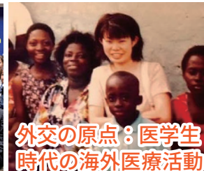
外交の原点：医学生 時代の海外医療活動